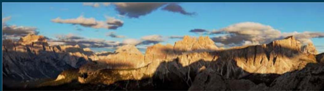
Croda da Lago, Lastoni di Formin e Pelmo