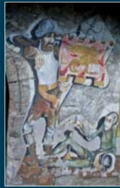
Muroles a Cibiana