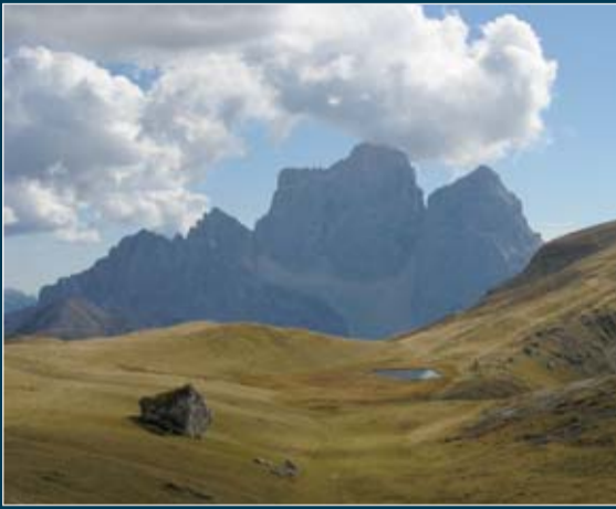
Piana di Mandeval col masso erratico dov'è stata trovata la sepoltura

ASPETTI ANTROPICI E ANTROPOLOGICI/ASPETTI ANTROPICI E ANTROPOLOGICI/ASPETTI ANTROPICI E ANTROPOLOGICI