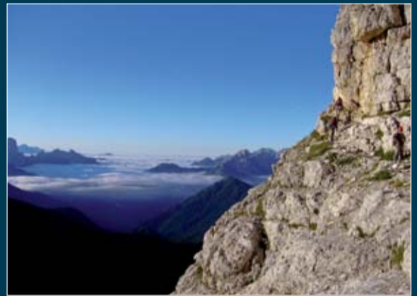
Cengia sul Pelmo