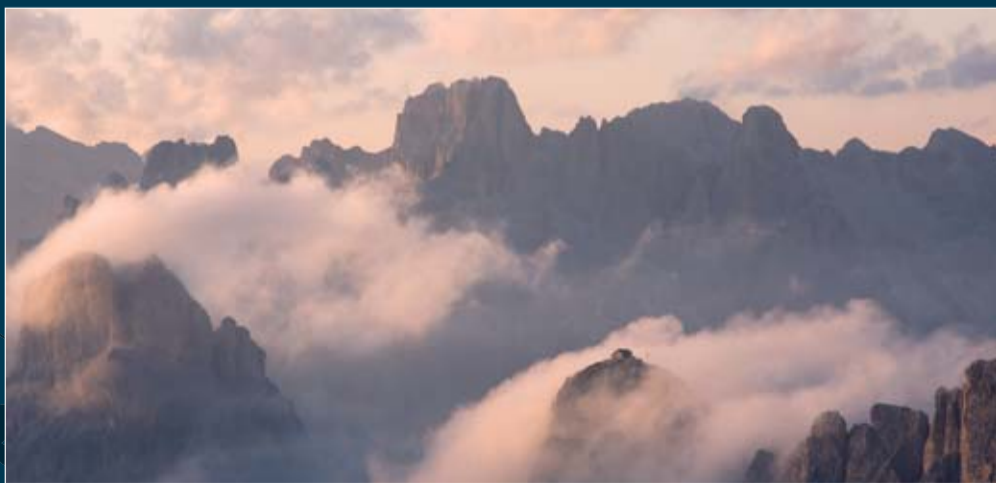
Rifugio Nuvalau tra le nubi