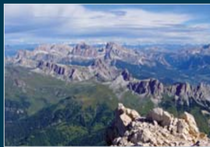
Panorama verso N del Pelmo

Alleghe con il Civetta, di E.T. Compton