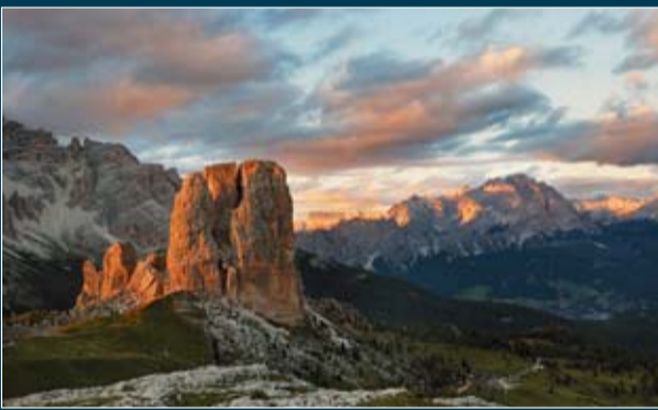
5 Torri e Dolomiti Ampezzane