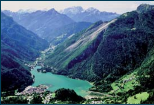
Lago di Alleghe