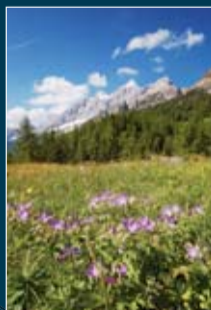
Fioriture ai piedi della Civetta

ASPETTI FLORISTICI VEGETAZIONALI E FAUNISTICI ASPETTI FLORISTICI VEGETAZIONALI E FAUNISTICI ASPETTI FLORISTICI VEGETAZIONALI E FAUNISTICI