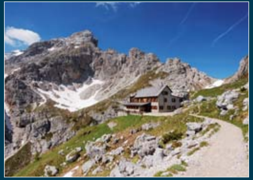
Rifugio Sorina al Coldai - Civetta