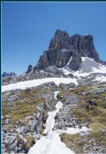
Averau e trincee

>Lorem Ipsum is simply dummy text of the printing and typesetting industry. Lorem Ipsum has been the industry's standard dummy text ever since the 1500s, when an unknown printer took a galley of type and scrambled it to make a type specimen book. It has survived not only five centuries, but also the leap into electronic typesetting, remaining essentially unchanged. It was popularised in the 1960s with the release of Letraset sheets containing Lorem Ipsum passages, and more recently with desktop publishing software like Aldus PageMaker including versions of Lorem Ipsum.