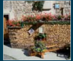
Angoli a Cibiana