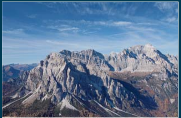
Molazzo e Civetta