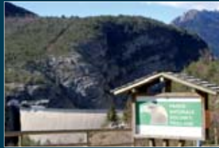
Diga del Vajont, segni del passato