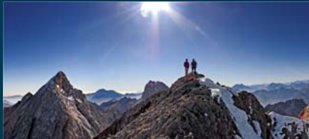
Da Cima Ladra verso Cima dei Pecci e Duranno