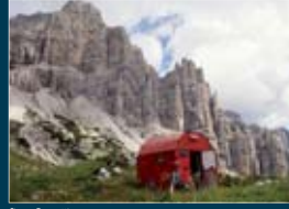
Bivacco Cernuschi