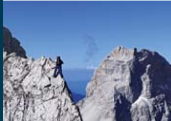
Vecchio Corno dei Pini (2706 m), seconda cima più alta del Friuli