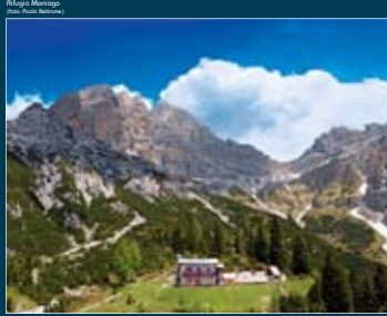
Alpe di Marozzi

ASPETTI ANTROPICI E ANTROPOLOGICI/ASPETTI ANTROPICI E ANTROPOLOGICI/ASPETTI ANTROPICI E ANTROPOLOGICI