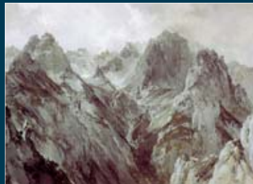
Costoro di montagna della Val di Brissone dai Montefalco disegno di E. T. Capponi