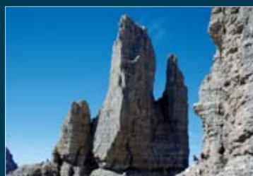
Punta Piz