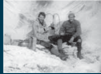
Compianto collocato nel 1926 e demolito nel 1979 da Enzo Migotto e Stefano Zucchiatti (archivio DA Fontana)

ASPETTI ALPINISTICI/ASPETTI ALPINISTICI/ASPETTI ALPINISTICI