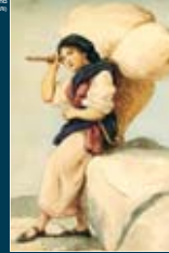
Fontaine simbolo (disegno: E. Berti - collezione D)