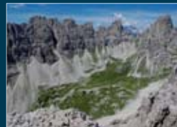
Dalla cima dei Pecci, la val Montefalco di Fara