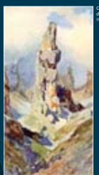
Compianto di M. M. disegno di E. T. Compton (archivio DA)